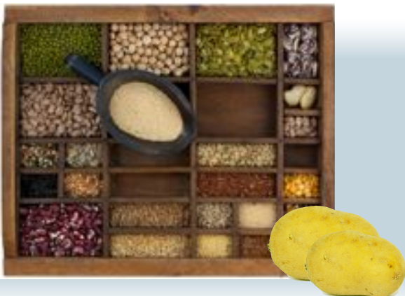
Rotfrukter, Potatis, Baljväxter, Quinoa,...